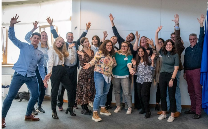
Les partenaires lors du kick-off d'Entrepubl à Namur