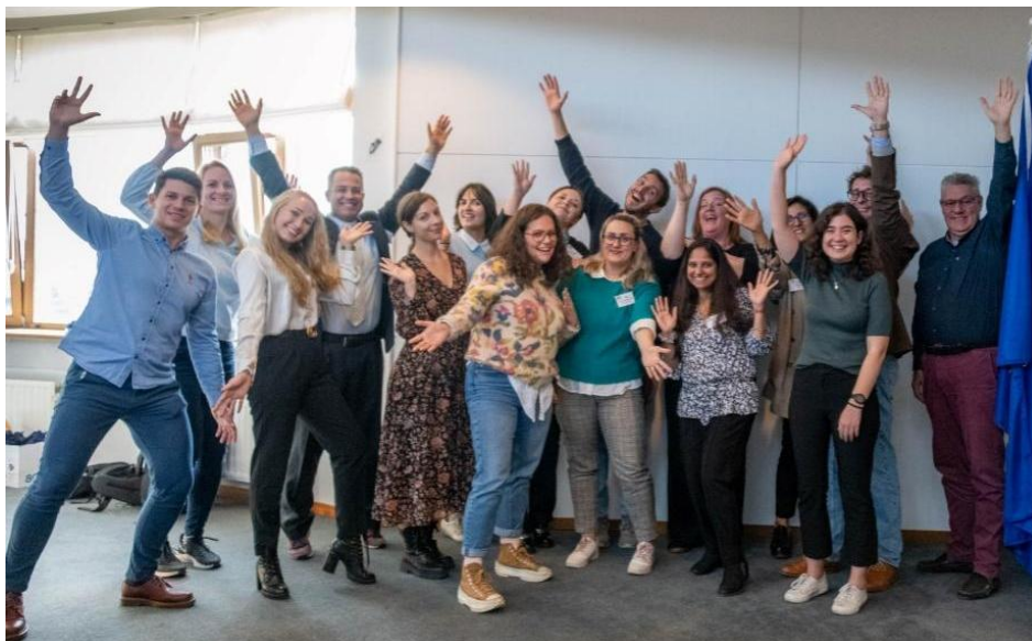
Partenerii EntrePubl la emoționanta întâlnire de lansare